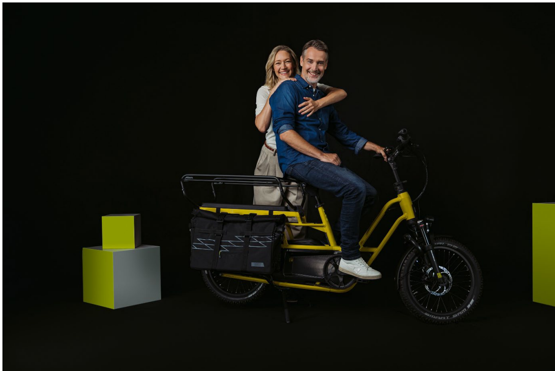
KETTLER FLAIR L-N