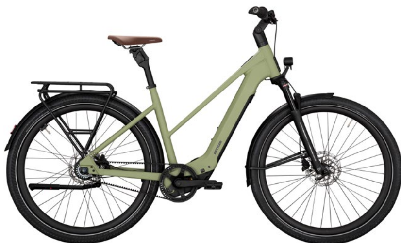
KETTLER SCINTO URBAN SX8B

Hier setzt KETTLER auf den Bosch SX-Motor, der auf höhere Trittfrequenzen abgestimmt ist und dabei sehr harmonische Unterstützung bietet. Die ca. 21 kg leichten und hochwertig ausgestatteten E-Gravelbikes sind ab Februar 2025 verfügbar.